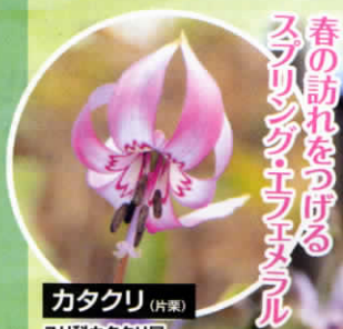
カタクリ (片栗) ユリ科カタクリ属 (学名 Erythronium japonicum)

カタクリまつりは、清瀬の美しい景観をつくっている武蔵野の雑木林への関心を、その林床に咲くカタクリを象徴としてアピールし、雑木林の保護と育成への意欲を高めることを目的として、行われます。