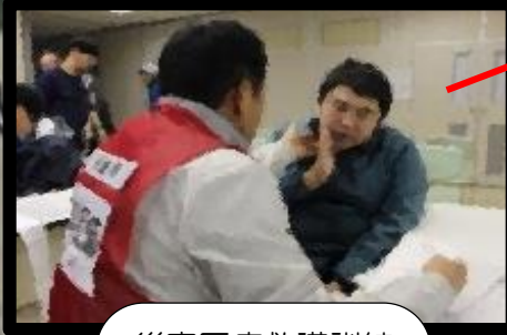
災害医療救護訓練