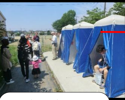
マンホールトイレ展示